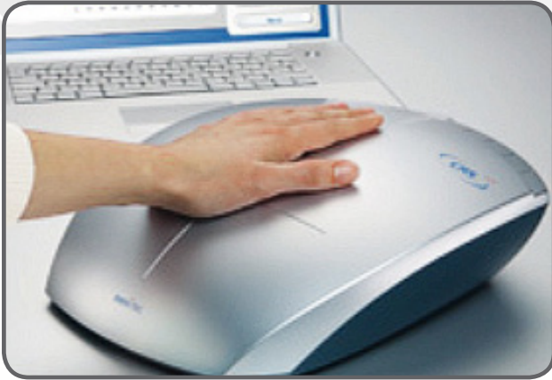
CRS - „Cell Regulation System“